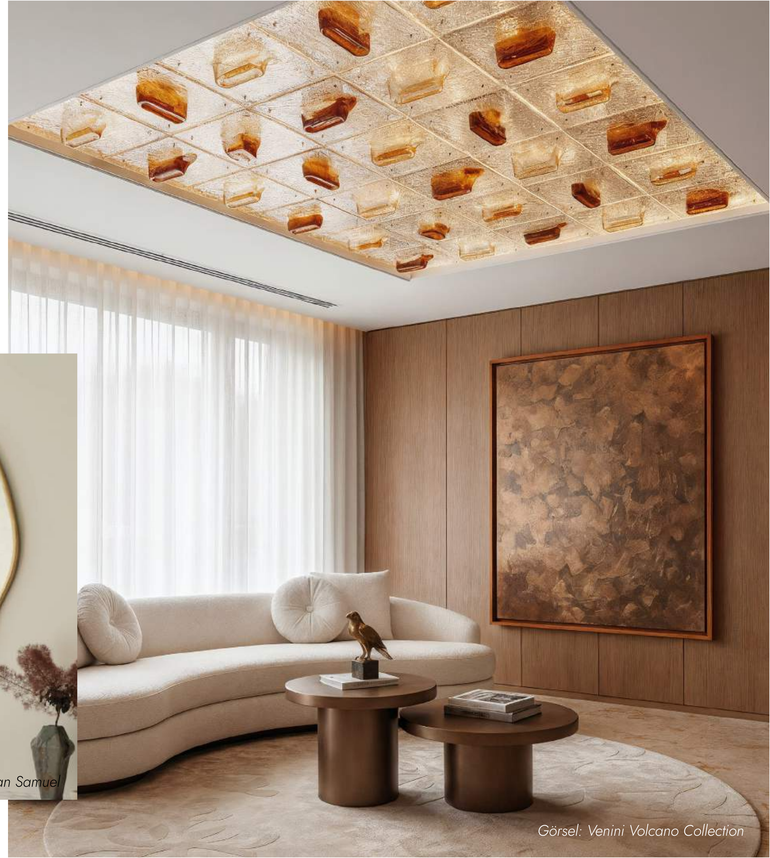
Görsel: Venini Volcano Collection