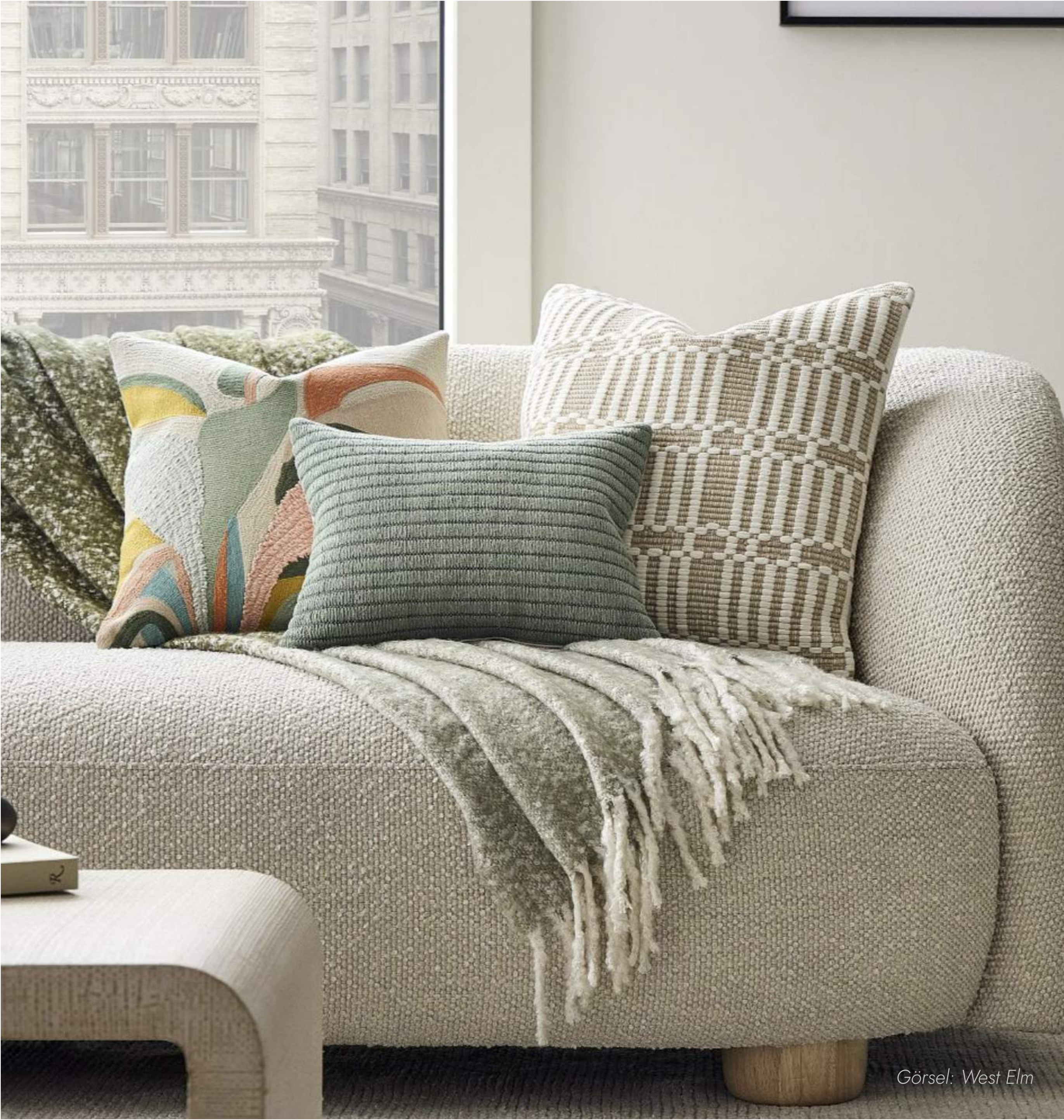
Görsel: West Elm